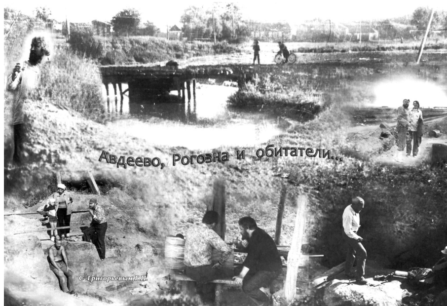
Ракопки в Авдеево. Коллаж