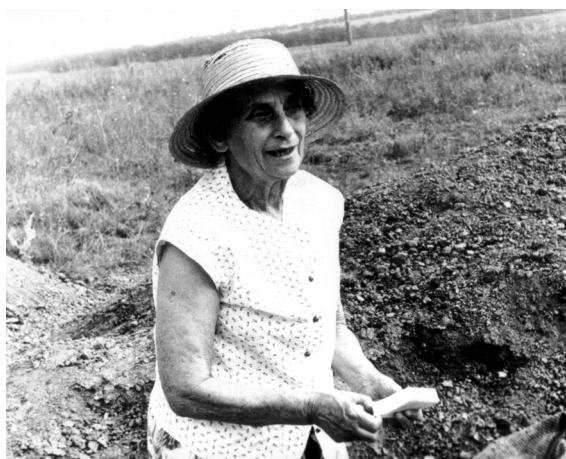
М.Д. Гвоздовер в Каменной Балке. 1980-е гг.